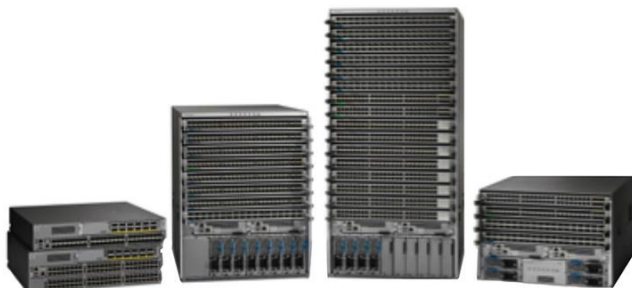
图 1. Cisco Nexus 9000 系列交换机

Cisco Nexus ® 9000 系列交换机（图 1）是下一代的数据中心交换基础设施。在 Cisco ® NX-OS 软件模式下，Cisco Nexus 9000 系列可应对当前基础设施设计的新挑战，同时以第一代软件定义网络 (SDN) 解决方案为基础，并提供通向思科以应用为中心的基础设施 (ACI) 的路径。在思科 ACI 模式下，Cisco Nexus 9000 系列利用自定义开发的硬件和软件的强大组合，提供业内最先进的 SDN 方案，从而提供市场上最可靠、最全面的解决方案。