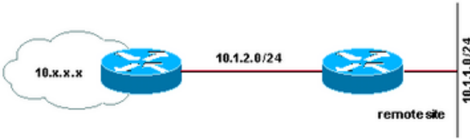
라우팅 프로토콜 실행 안 함