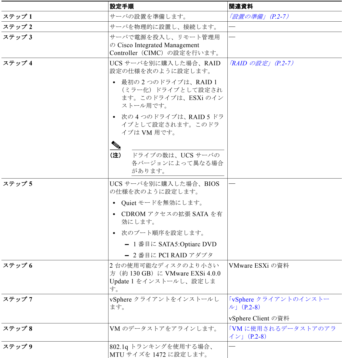
表 2-4 サーバのインストールおよび設定に関する設定チェックリスト

表 2-4 (P.2-6) に、Cisco Emergency Responder を Cisco UCS サーバにインストールして設定するために必要な、主な手順のチェックリストを示します。