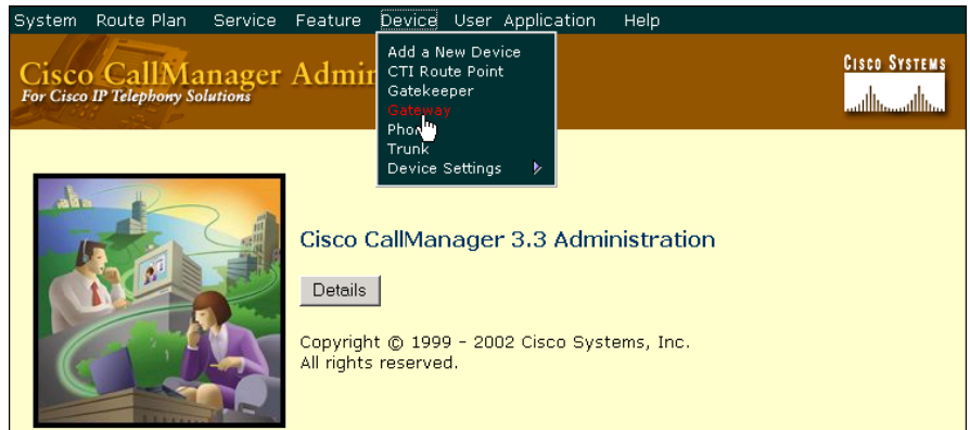
図 6-2 Cisco CallManager Administration の Device メニュー