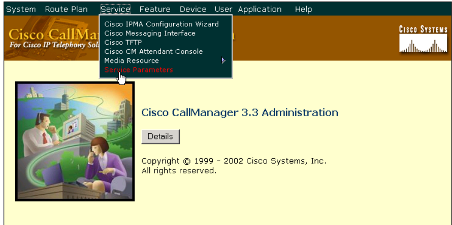
図 6-1 Cisco CallManager Administration の Service メニュー

Cisco CallManager Administration でこのサービスを無効にし、 Service > Service Parameters を選択します。表示されたメニューで、サーバと Cisco CallManager サービスを選択します（図 6-1 を参照）。