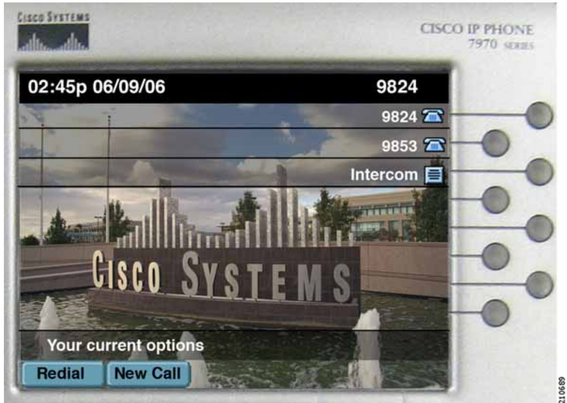
図 28-10 アイドル

アンナが、アイドル状態のときに、ジェラルドにインターコム コールを発信します。インターコム回線には、発信先が事前設定されていません。