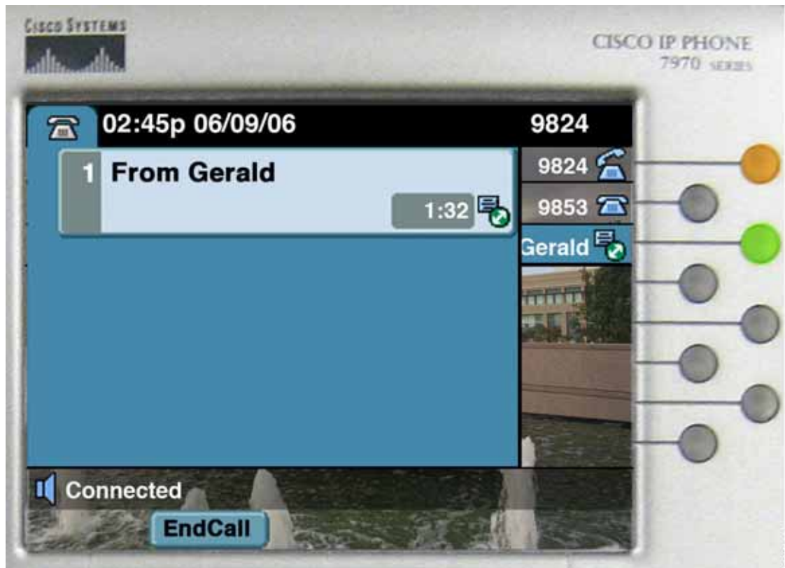
図 28-8 接続時

アンナが、ウィスパー状態または接続時状態のインターコム コールが存在するときに、プライマリ回線で新しいコールを受信します。