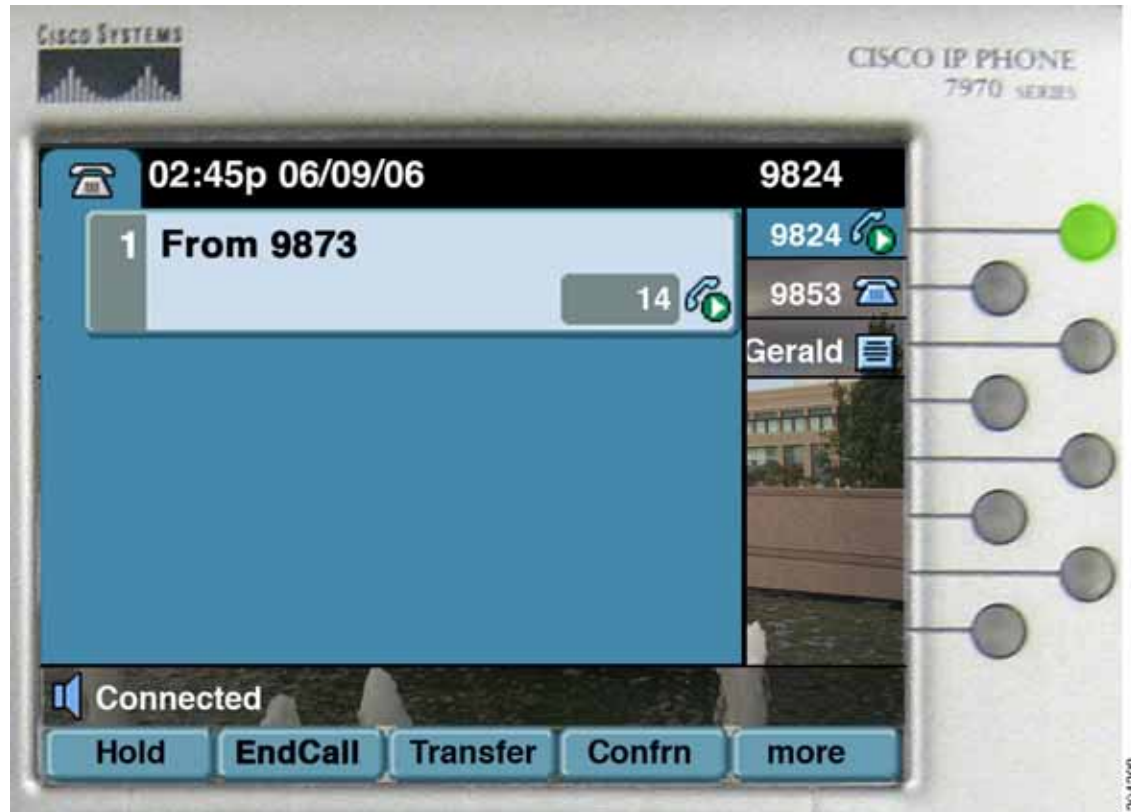
図 28-9 アイドル