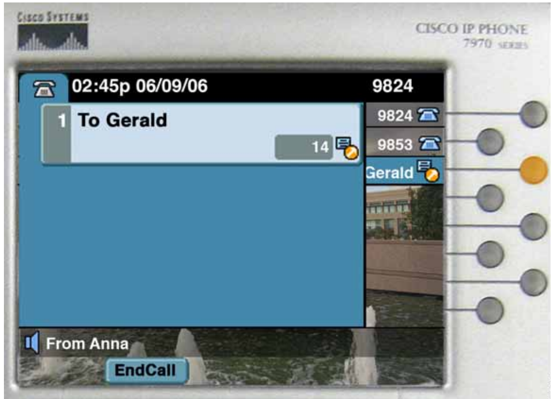
図 28-4 ウィスパー

アンナが、自分の電話機がアイドル状態のときに、事前設定されたインターコムの発信先であるジェラルドの電話機にインターコム コールを発信します。