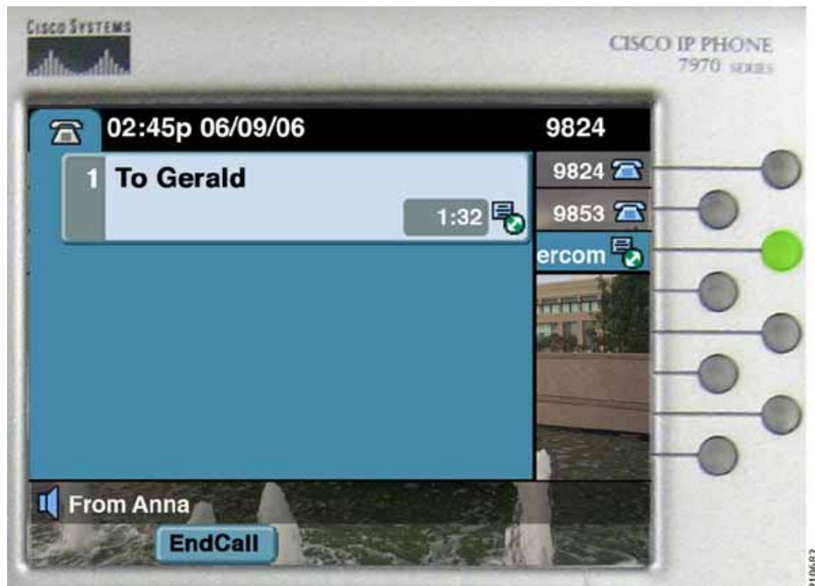
図 28-7 接続時