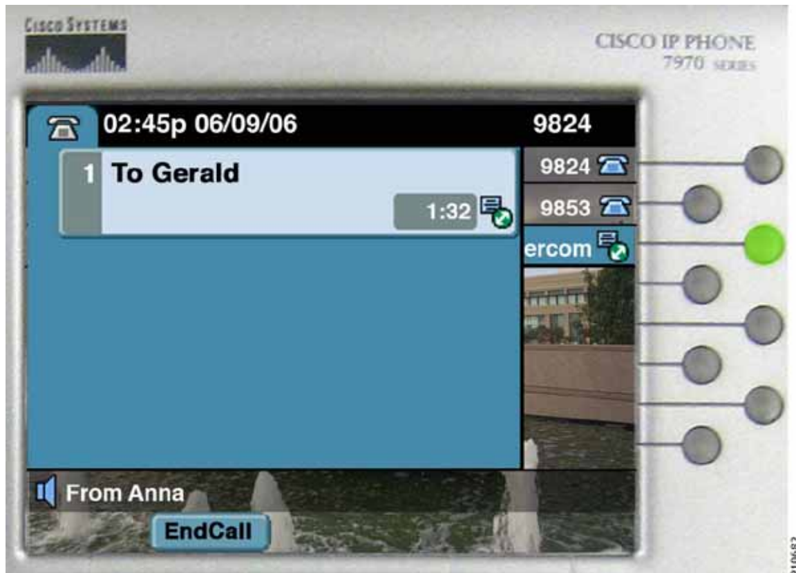
図 28-14 接続時