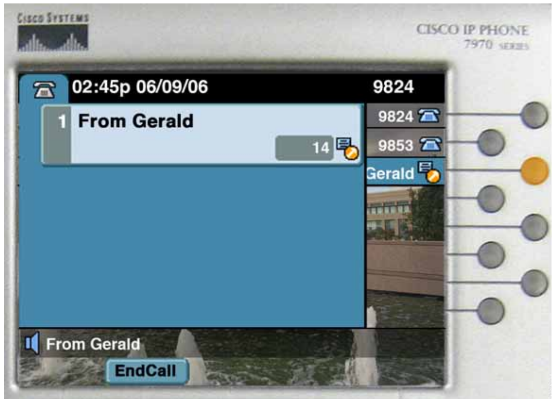
図 28-2 ウィスパー