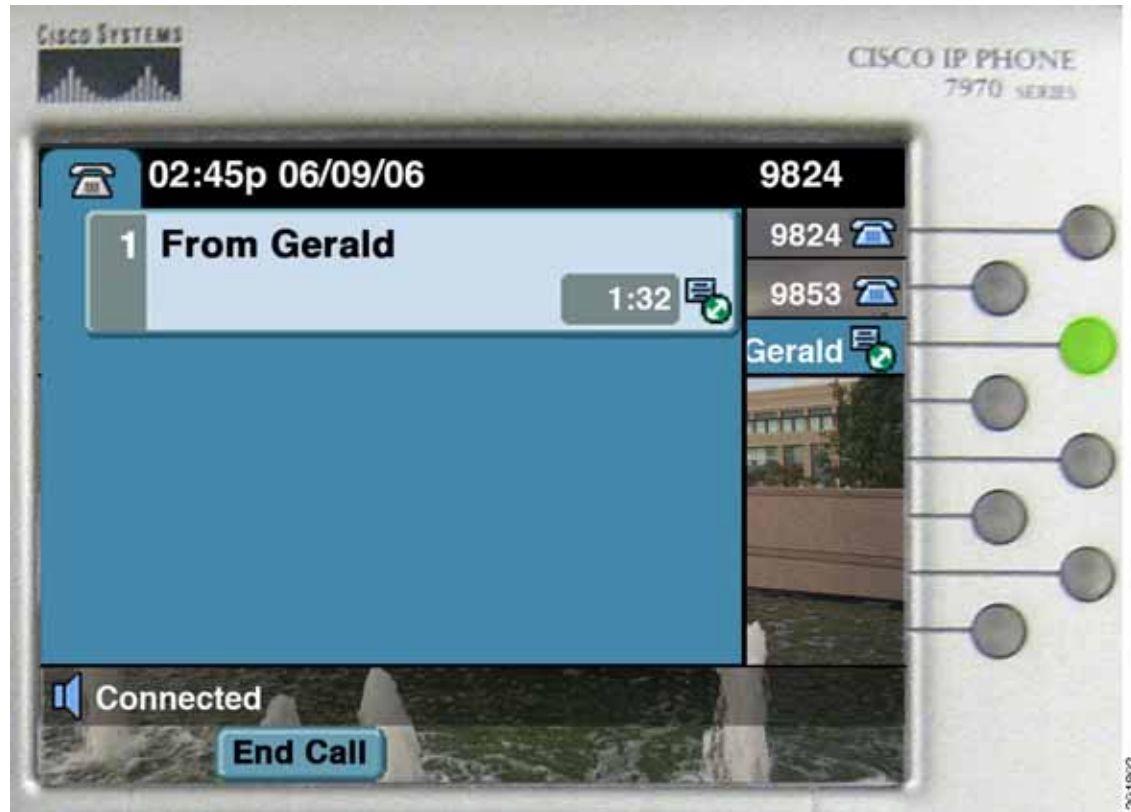
図 28-3 接続時