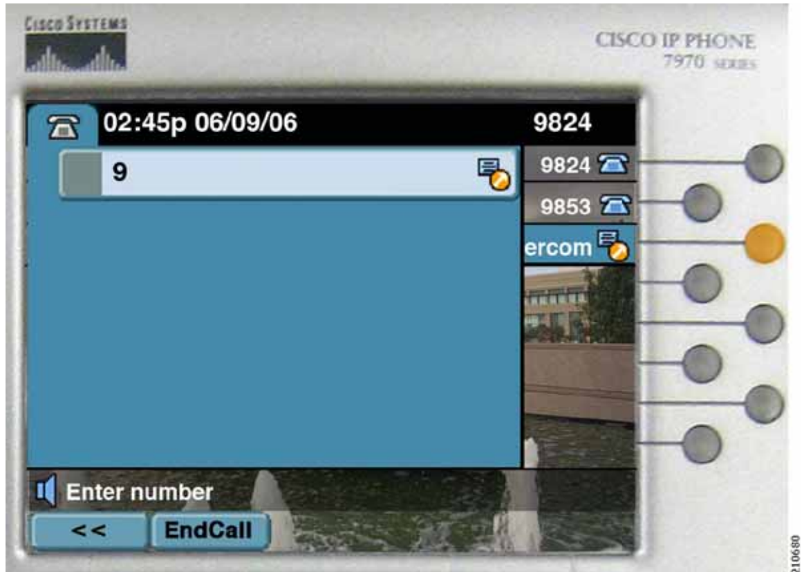
図 28-12 先頭桁入力後