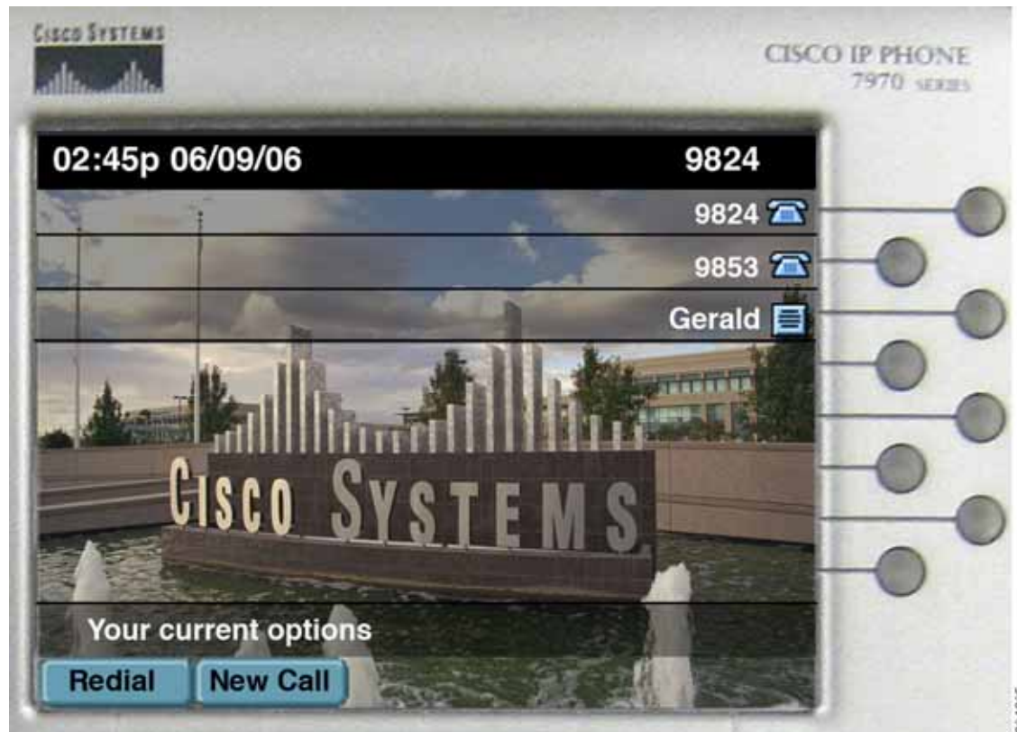
図 28-1 アイドル

アンナの電話機が、アイドル状態のときに、事前設定されたインターコムの発信先であるジェラルドからインターコム コールを受信します。