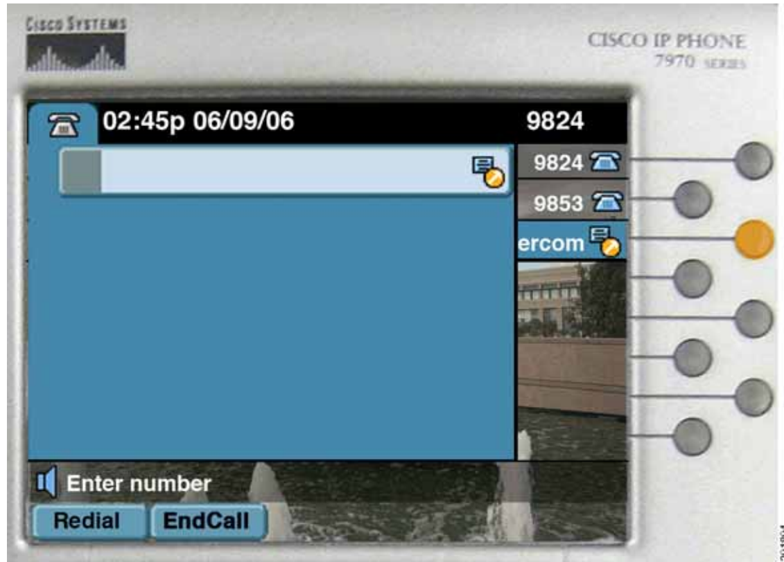
図 28-11 ダイヤルアウト