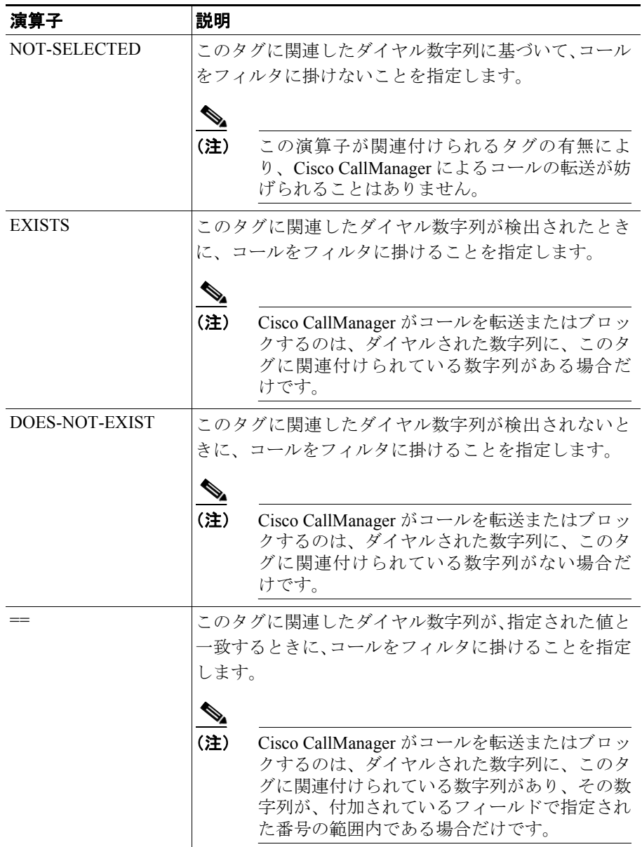
表 16-3 ルートフィルタの演算子