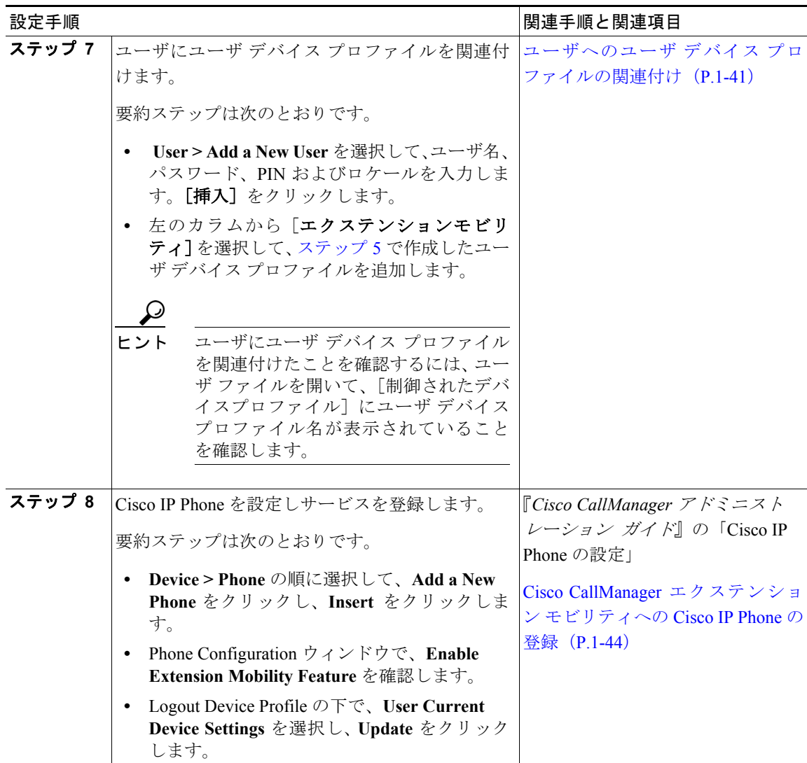
表 1-1 Cisco CallManager エクステンション モビリティの設定チェックリスト (続き)