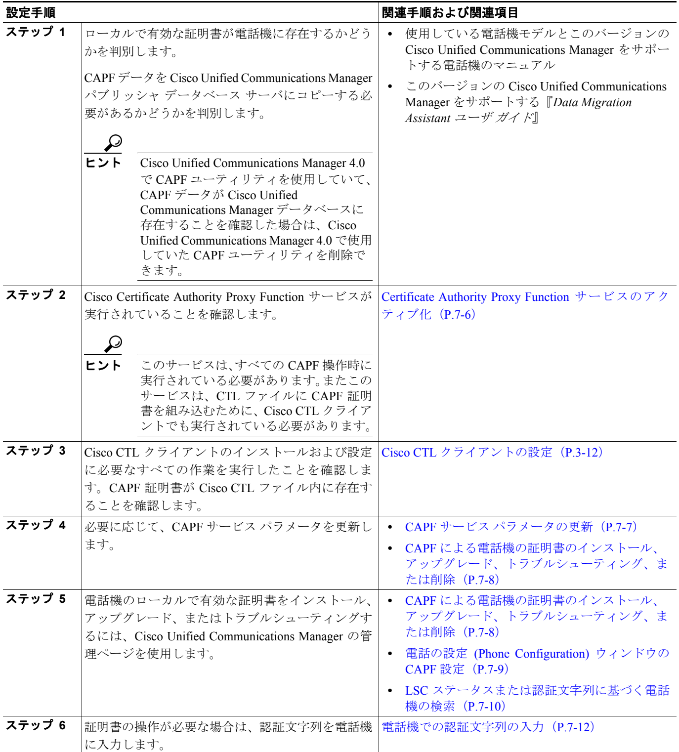
表 7-1 CAPF の設定用チェックリスト

表 7-1 に、ローカルで有効な証明書をインストール、アップグレード、またはトラブルシューティングする場合に実行する作業のリストを示します。