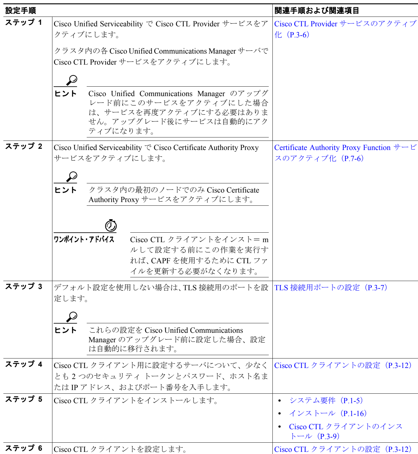
表 3-1 Cisco CTL クライアントの設定用チェックリスト

表 3-1 に、初めて Cisco CTL クライアントをインストールおよび設定する場合に実行する設定作業のリストを示します。Cisco Unified Communications Manager をアップグレードするときの CTL ファイル設定の詳細については、P.3-11 の「Cisco CTL クライアントのアップグレードおよび Cisco CTL ファイルの移行」を参照してください。