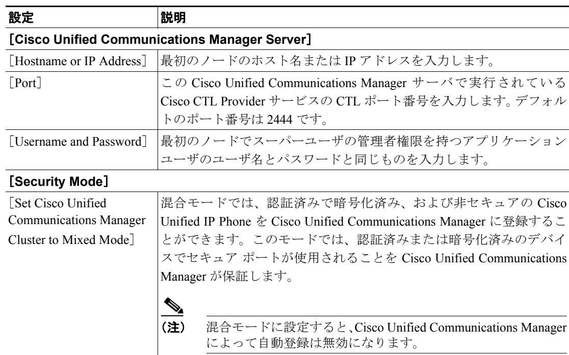
表 3-2 CTL クライアントの設定内容