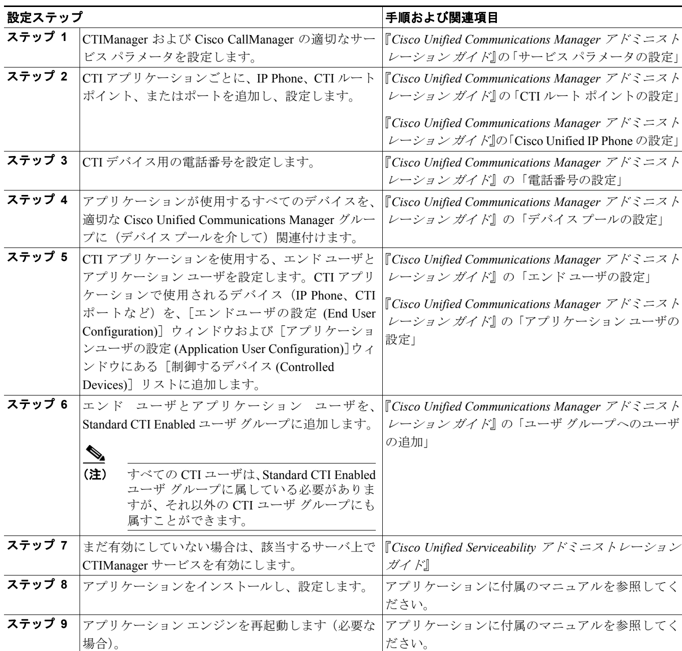
表 46-1 CTI 設定チェックリスト

(注) CTI アプリケーションをセキュリティ保護するには、『Cisco Unified Communications Manager セキュリティガイド』で CTI の認証と暗号化の設定に関する説明を参照してください。