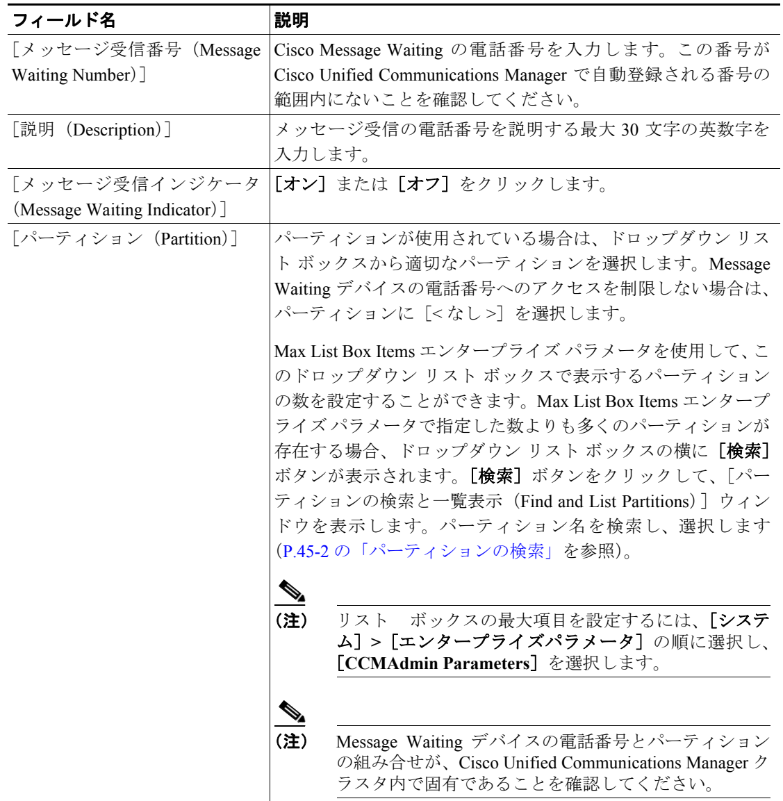
表 76-1 メッセージ受信の設定値