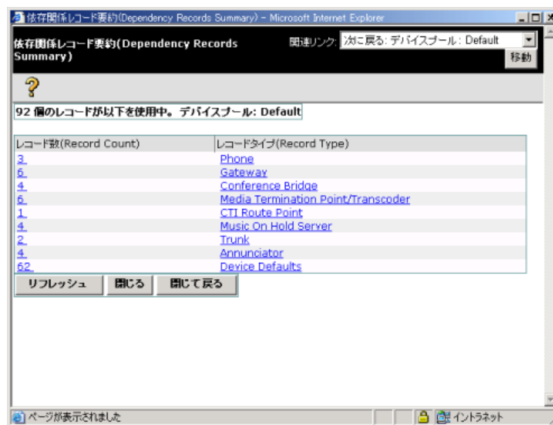
図 A-1 依存関係レコード要約 (Dependency Records Summary) の例

依存関係レコードの詳細情報を表示するには、表示対象のレコードをクリックします (たとえば、トランク レコードをクリックします)。[依存関係レコード詳細 (Dependency Records Detail)] ウィンドウが表示されます (図 A-2 を参照)。元の設定ウィンドウに戻る場合は、[関連リンク] リストボックスから [要約に戻る] を選択して [移動] をクリックします。その後、[次に戻る :< 設定ウィンドウ名 >] を選択して [移動] をクリックするか、または [閉じて戻る] ボタンをクリックします。