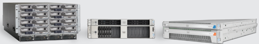
図 2 コンピューティング専用ノードとして Cisco UCS サーバと組みあわせ可能な Cisco HyperFlex ファミリー